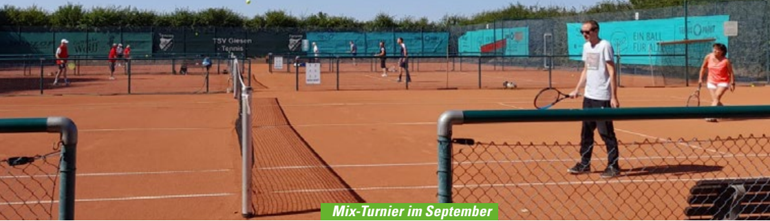
Mix-Turnier im September