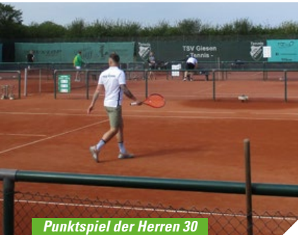
Punktspiel der Herren 30