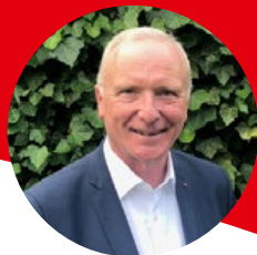
Bernd Westphal MdB