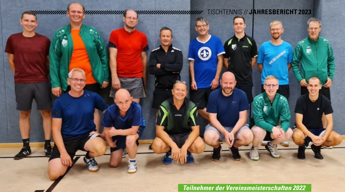
Teilnehmer der Vereinsmeisterschaften 2022

Unmittelbar vor Saisonbeginn wurden die Vereinsmeister 2022 ermittelt. Im Erwachsenenbereich traten 14 Teilnehmer in drei Gruppen – samt Trostrunde – gegeneinander an.