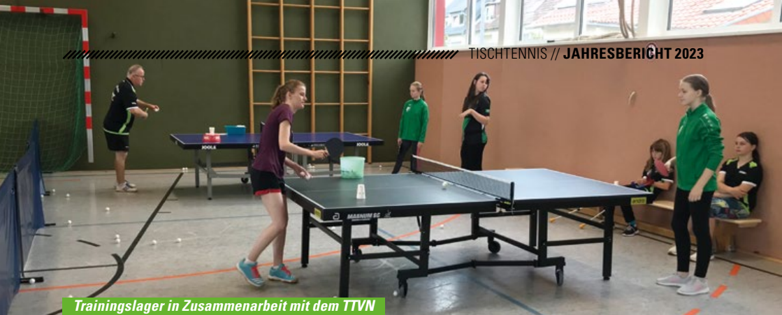
Trainingslager in Zusammenarbeit mit dem TTVN