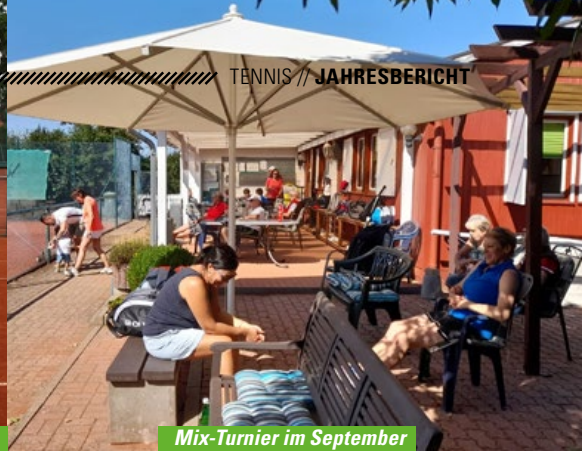
Mix-Turnier im September