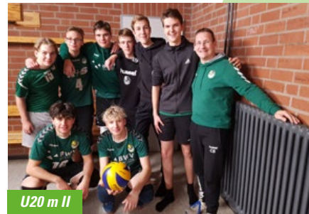
U20 m II