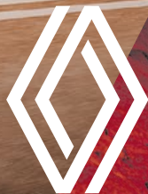
Abb. zeigt Renault Austral E-Tech Full Hybrid Techno Esprit Alpine mit Sonderausstattung.

Renault Austral Mild Hybrid 140, Benzin, 103 kW (140 PS): Gesamtverbrauch (l/100 km): niedrig: 7,4; mittel: 5,8; hoch: 5,3; Höchstwert: 6,7; kombiniert: 6,2; CO 2 -Emissionen kombiniert (g/km): 139. (Nach gesetzl. Messverfahren, Werte nach WLTP).