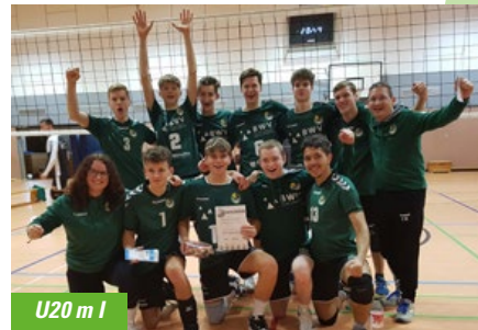
U20 m I

In Aktion treten die jungen GRIZZLYS auch immer bei den Bundesliga-Spielen der ersten Mannschaft. Als Ballroller, Wischer, Trommler oder mitfiebernder Zuschauer sind dann viele von ihnen in der Sporthalle anzutreffen.