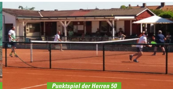
Punktspiel der Herren 50

Besonders stolz sind wir auf unsere Jugendlichen im Alter von 6 bis 17 Jahren, die uns viel Freude bereiten. Mit viel Spaß und Freude sind sie nicht nur in der Sommersaison, sondern auch in den Wintermonaten im Training mit engagierten Trainern.