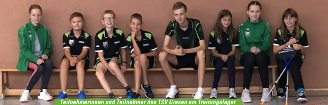
Teilnehmerinnen und Teilnehmer des TSV Giesen am Trainingslager