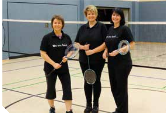
„Unsere eifrigsten Spielerinnen“

Nach wie vor erfreut sich diese Sportart großer Beliebtheit im TSV. Das Wichtigste bei unseren wöchentlichen Treffen ist der Spaß am Sport. Neben dem Trainingsfaktor für diese Sportart, werden auch allgemein die Ausdauer, Kondition sowie Reaktion und Beweglichkeit gefördert. Große Vorkenntnisse sind nicht nötig. Badminton ist auch eine Sportart, an der die ganze Familie teilnehmen kann. Das Alter spielt keine Rolle, ob jung oder alt, jeder kann den Schläger schwingen und Badminton spielen.